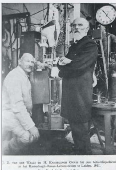
J. D. VAN DER WAALS en H. KAMERLINGH ONNES bij den heliumliquefactor in het Kamerlingh-Onnes-Laboratorium te Leiden. 1911.