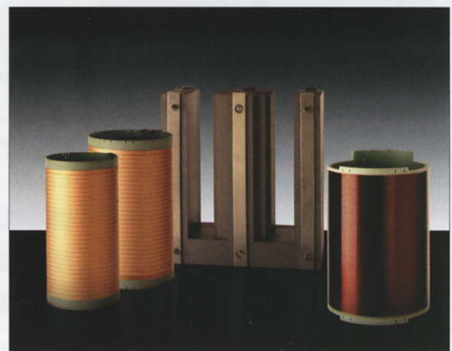
Bild 9 (links): Supraleitender und induktiv geschirmter Strombegrenzer iSFCL mit geringen Kühlungsanforderungen