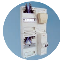
Spezialschränke für die private und gewerbliche Energieerzeugung