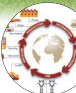
Dienste für die Lebenszyklusbewer