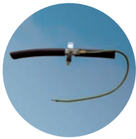
Niederspannungs- Kupfer- und -Aluminiumkabel