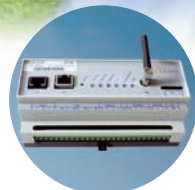
Dienste für Überwachung und Steuerung