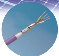
Sensor- und Buskabel für Tracking-Systeme