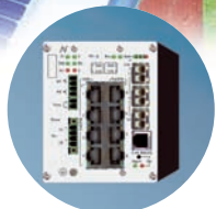
Aktive Switch-Systeme für Kommunikation und Überwachung